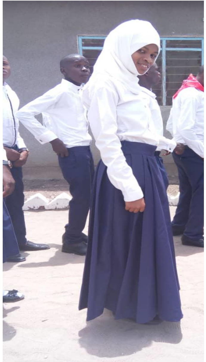
(ii) Picha B