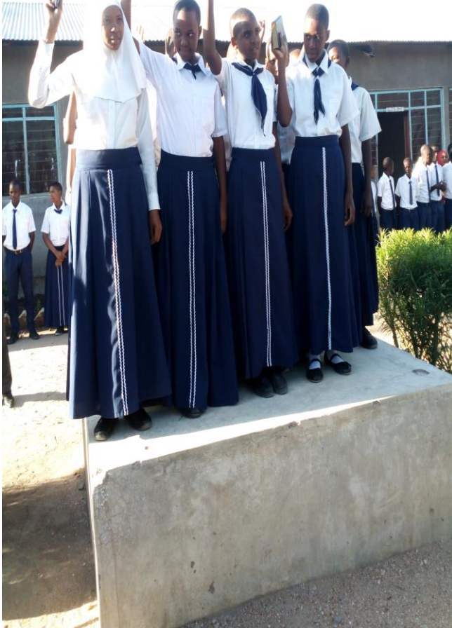
(i) Picha A